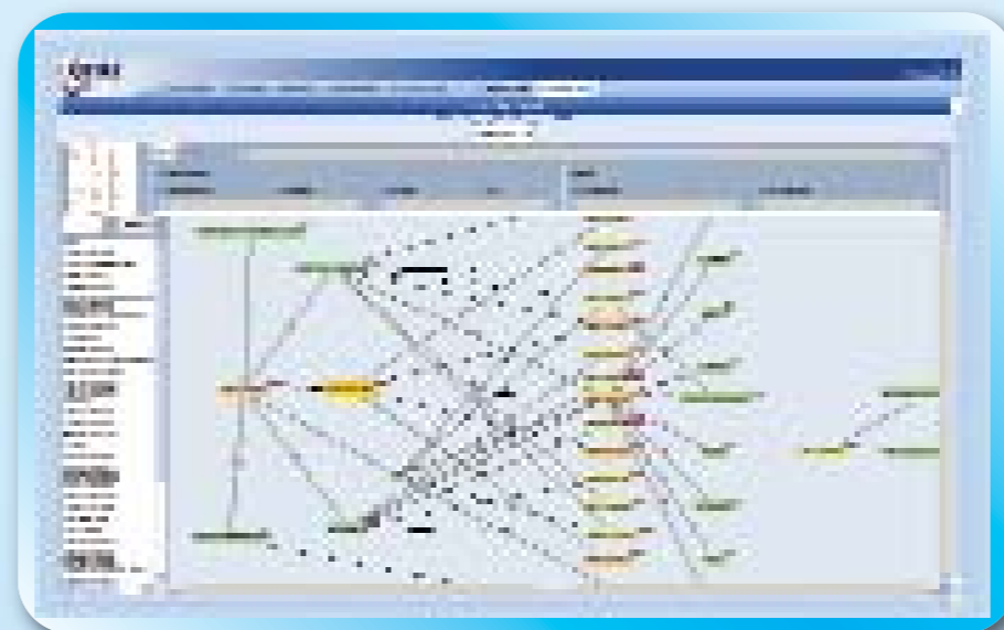
Graphe du croisement déposants/CIB